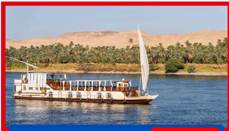
CRUISE NILE DINNER