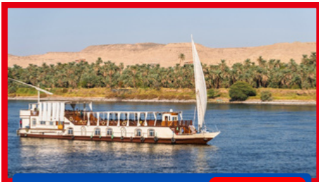
CRUISE NILE DINNER