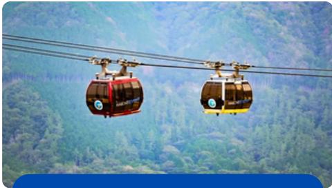
CABLE CAR DI GULMARG