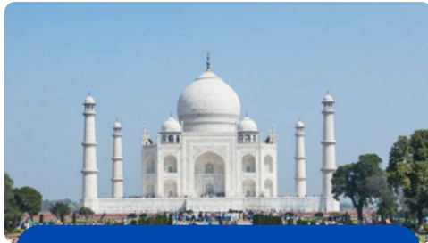
TIKET MONUMEN TAJ MAHAL