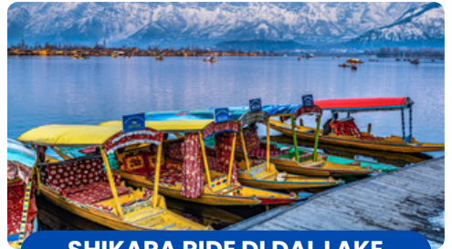
SHIKARA RIDE DI DAL LAKE KASHMIR