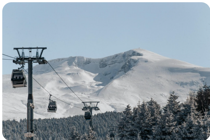
Mt. Uludag, Bursa